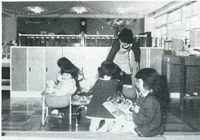
3歳未満児の保育風景

昭和55年度において改築事業が進められていた中央保育所が完成し、乳児・3歳未満児の保育が軌道にのりました。56年度には、佐貫保育所の工事も予定されており、昭和60年度までには老朽化の著しい保育所から順次改築されて、乳幼児保育の充実が図られる予定です。 そこで、施設の完備した中央保育所を訪ね、保育の実際を紹介することにしました。