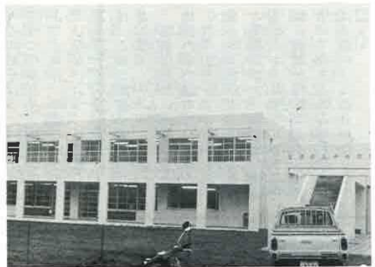
完成した中央保育所