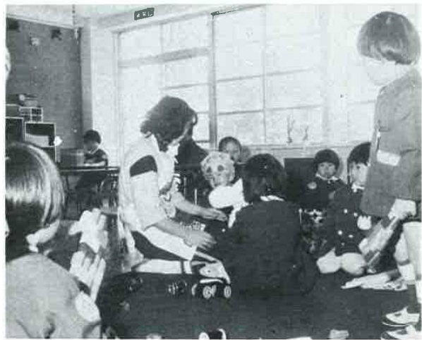
保育室での3歳児たち

保育所では、副食とおやつが与えられますが、3歳未満児の特徴は、完全給食であるということです。 専門の栄養士によって、年齢に合わせた給食が与えられ、離乳期にある乳児には、もちろん離乳もします。 おむつの離れない幼児についても心配はいりません。根気よく無理のない習慣づけの中で、排せつのしつけも行われるよう配慮されています。