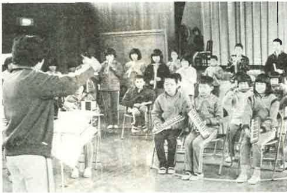
器楽演奏もたて割りで (環南小)