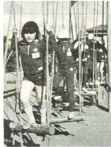
業間体育で体力づくり (佐賀小)

平常の目録の中で理解しきれないものを補い子供の相互協力の中で自信を持たせることがねらいです。 ●時間のとり方と方法 ・毎週金曜日2時間、教科補習・学習相談・話し合いを。従来の学校行事もこの時間を使い、計画から反省まで子供中心に行う。 毎日12時40分~13時 校内清掃を1年~6年までのたて割りで。