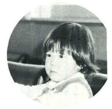
広報にのっている写真にあなたが写っていたらサービスサイズ1枚さしあげます。申し込みは広報係まで