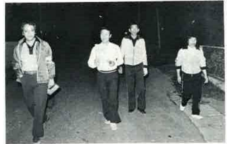
大山地区交友会の皆さん

えとともに響く拍子木の音で「火の後始末」。「ガスの元栓」。「戸締まり」と、もう一度確認する習慣ができました。おかげで我が家は、毎日安心して過ごさせていただいております。