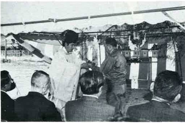
送水ポンプ場建設地(水道部庁舎前)で起工式