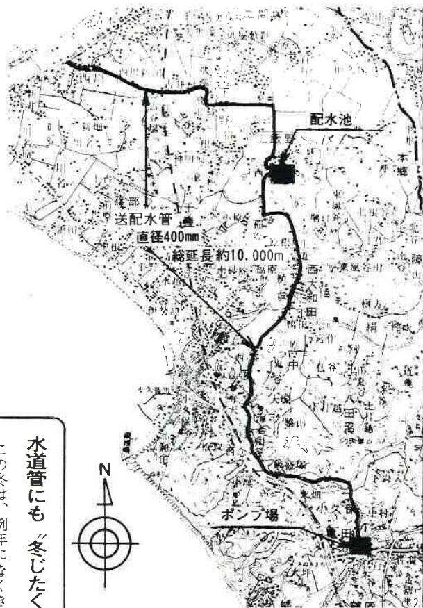
○送配水管建設位置図