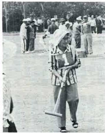
▲ ゲートボールに元気いっぱい 木製のボールをスティックを使って三つのゲートを開くゲーム。先月19日には大貴小学校のグラウンドに市内32チームが参加して大会も開かれています。