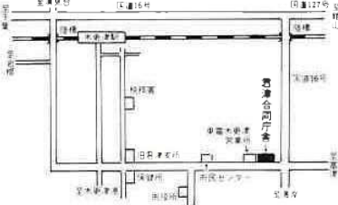
千葉県君津合同庁舎ご案内 (木更津市貝淵3-1-3)