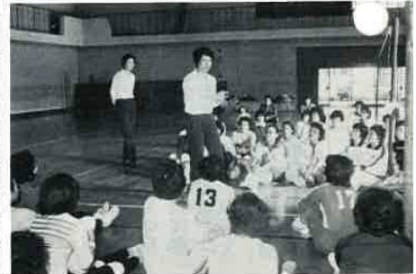
▲ トッププレイヤーを講師にバレーホール講習会

い計量器を取引きなどに使用すると、法により処罰されることがあります。今年の検査は、次表の日程で行い