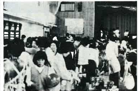
▲ 第1回福祉バザーが開催

10月13日、袖ヶ浦臨海スポーツセンターで開かれた、若津地方婦人団体スポーツ大会で、富津市連合婦人会は2年連続優勝の輝かしい成績を修めました。