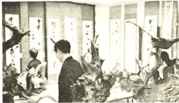
上 生花展 下 書道・木工芸展