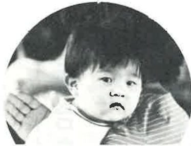
広報にのっている写真にあなたが写っていたらサービスサイズ1枚さしあげます。申し込みは広報係まで