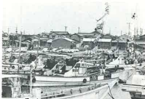
漁港から住宅地を望む

富津浜町は、岬なりに、東町、中町、西町につづく町。北側は漁港で、国道十六号線沿いの小さな区域で戸数は二四〇戸。なかなか活気に満ちている区です。 昔はほとんど漁業で、漁港寄りに密集する部落でしたが、国道十六号線の南側にのび始めたのは、戦後の事だと言います。これも他からの移住者ではなく、多くは富津地付きの人達だと言いました。それだけに、まともにもよく、連帯の強い、富津のよさを誇っているように見えます。 昔は平貝、ミル貝、シヤコなどを採る潜水漁業者の多い町でしたが、今でも転