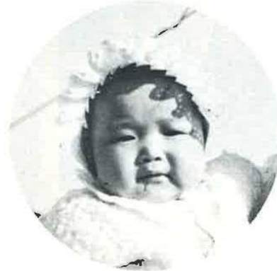
広報にのっている写真にあなたが写っていたらサービスサイズ1枚さしあげます。申し込みは広報係まで