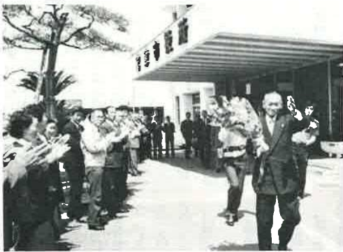
5月12日、白井市長の退任式が行われました。 (職員の拍手に送られて庁舎を出る市長)

昨年一月と六月の間に、全国で四五三人の少年、少女が自殺しています。その動機は、トップは学校での問題、次いで男女関係、病気などとなっています。しかし、その死への理由のどれをとっても、大人の目から見れば、必ずしも死と直結するものとはいえず、理解の手がかりさえも見出しえない場合が多いといわれます。大人たちに理解できないとは言え、事実、少年たちは苦しみぬき、その結果、自らの生命を断ったのです。その胸中は察するに余りありません。