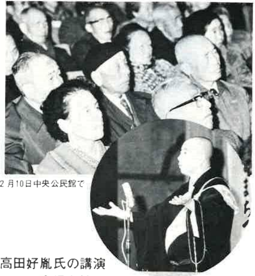
2月10日中央公民館で