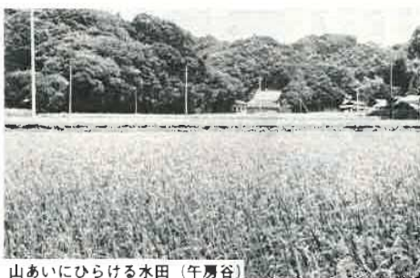
山あいにひらける水田(午房谷)

です。区長のこの言葉でもわかるように、専業と兼業と、現代農業の持つこの異なった二つの面が、この区にも同居しているのでしょうか。