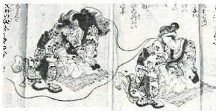
子間引きを戒める絵解き文

全国に先駆けて行われたこの業績により、翌明治六年の木更津県の出生は、一躍七千七百人も増加したといわれています