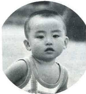
広報にのっている写真にあなたが写っていたらサービスサイズ1枚さしあげます。申し込みは広報係まで

LPガス法の施行規則の改正で、7月1日から2年間、全国いっせいに、ガスを利用して一般家庭等の設備を点検することになりました。点検の主な内容は、 ・配管 ・調整器 ・煙突と給気口 ・ゴムキャップ、ホースバンド、三通又、コック ・屋外のゴムホースなどで、それぞれガスを納品している