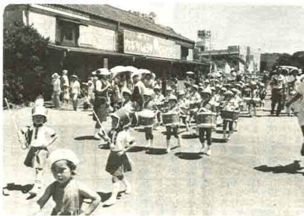
夏季の交通安全運動に明澄幼稚園児も一役。国鉄青堀駅前