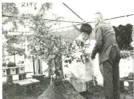
小久保ダム起工式

水道事業の水源は、地下水と表流水に求めています。天羽水道も大佐和水道も、第一次拡張事業は、表流水を取水する計画が進められ、天羽水道は、すでに湊川取水場の建設も終り給水が行われています。