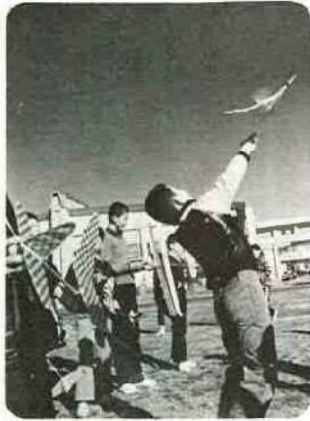
▲チビっ子も新年の遊び初め 正月の5日、郡津中学校で郡津地区の小学生400名が参加して、野球やバドミントン、マラソン、模型飛行機を飛ばしたりして、一日楽しく過ごしました。この遊びは、青少年相談員のお兄さん、お姉さんが子供たちの友情や、体力作りのために、毎年新春に行うもので、今年で13回目になるそうです。

▶寒風の中で出初式 天羽中で 先月9日、恒例の消防出初め式が、寒風の吹きさらしの中、天羽中学校グラウンドで行われました。この際、消防団員による演法訓練や、消防署員のリインジャー隊など、日ごろ鍛えた演技を寒風にもめげず披露してくれました。