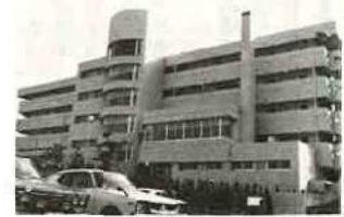
▲去る10月20日郡津中央病院敷地内に看護婦寮宿舎が新築されました。この建設費用の一部は皆さんの年金積立金の還元融資でまかなわれました。こんな所にも、あなたの年金が使われます。