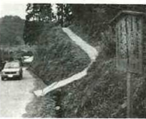
交通安全を呼びかける路傍の立札

時おり走る自動車の音、きじ鳩の鳴く声があたりの山々にこだまする相川の里。湊川の支流相川の流るれに沿って曲線を描くように、道路が、梨派地区に、伸びています。その道路の曲り角や、見通しの悪い場所、12か所に、「おたがい、声かけあっておたがい、感じました。」と毛筆で書かれた立札が通勤通学の人々に、呼びかけるように立てられています。これは、相川老人クラブ(クラブ員60名)が、交通安全を祈る暖かい心から、昨年立てたものです。