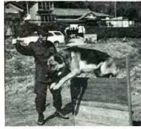
訓練の要領のような場面

平野 自発的に出動するのではなく、警察からの依頼をうけた場合だけ出動するので。まあ、年に二・三回でしょうが、ただ、夜間の場合が