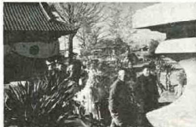
宮送りを再現 (八坂神社で)

富津東区は、東は川名、新井に隣接する、宇富津の一番東に位置する部落である。つまり長く突き出た富津岬のつけ根にあたる、一番東よりの部落といった方が、もっとわかりいかも知れない。