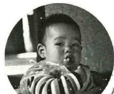
広報ののっている写真にあなたが写っていたらサービスサイズ1枚さしあげます。申し込みは広報係まで