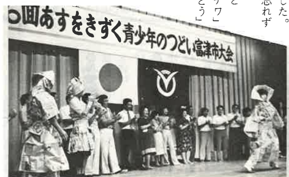
青少年相談員のファッションショー