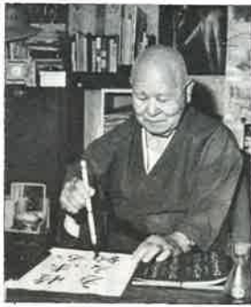
一字一字に心をこめ (書斎で)

石ぶみは、ただ字だけではなく、彫りが問題です。彫りがよくなければ、どんな字も死んでしまいます。しかし、辛いなことには、ものごもものだけにどの石屋も全力をあげて彫ってくれました。その点、私は本当に満足だと思っています。 問 長く後世に残るものだけに、立派なお仕事だったわけですね。どうか、これからもご精進下さい。 小宮 芸道は何ごとでもそうです。が、書も完成のない道です。今でも、私は毎日百枚は書いていますが、これだいたいと思ふことは一度だつてありません。入ればますます深く、仰げばますます高いという気持ちです。道の速さと共に、いのちの短かさを、身にしみて感じますよ。