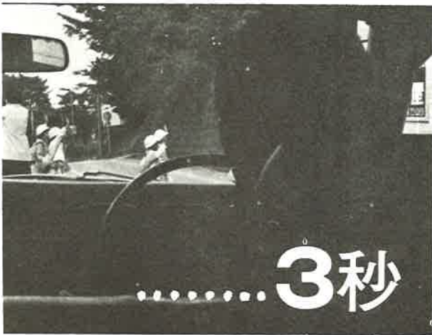
迎え交通事故が多発する時期です。日、歩行者もドライバーも基本的なマナーを以て件数と事故件数は反比例するのは残念なことは交通安全を呼びかけている。

酒気帯び、前方不注意により、人身事故を引き起こした者の当然の報いとして、これまで二十数年つちかかってきたすべてが崩壊し去った今、これ以上提供できるものといえ、我が身を刑務所の中で痛めつけるより手段が残っていないところまできていたのである。