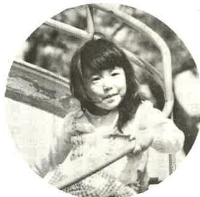
広報にのっている写真にあなたが写っていたらサービスサイズ1枚さしあげます。申し込みは広報係まで