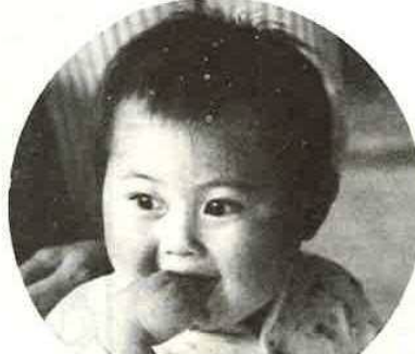
広報にのっている写真にあなたが写っていたらサービスサイズ1枚としあげます。申し込みは広報係まで