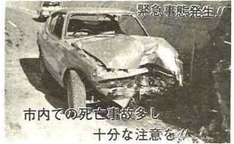
市内での死亡事故多し 十分な注意を

最近市内での交通事故による死亡者が異常に増え、今年に入ってから五月中旬までに七名と、前年度に比べ非常に