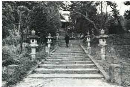
馬出し祭りが行われる吾妻神社

古く西大和田、絹、中、岩 瀬、近藤、八田沼、上を、吉 野郷七カ村と呼んだ。西大和 田、絹、中は、その吉野郷の 西部の地区である。 西大和田は野菜、絹、中は 米作を主としているが、いず れも昔からの農村地帯である しかし、駅に近く、道路網も 整備されているためか、近ご るこの地区の世帯数の増加は 目立っている。世帯数は現在 西大和田二二三、絹八四、中 七五、となっている。