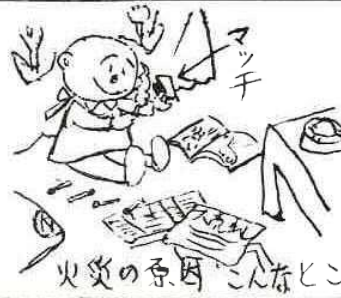
火災の原因 こんなところからも

昨年度から始められた弁天山古墳の整備は昨年石室保護用建物が出来、今は周囲の土盛りなど行なわれ来年の完成めざして急ピッチで工事が進められています。これは大切な公費で行なわれています。皆さんも土盛りを大切にして下さい。