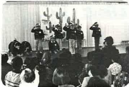
ひとり／ふたり……インディアン

2月8日、青丘体育園で遊戯会が行なわれました。子供たちの熱演にあかさんものり出して、拍手していました。