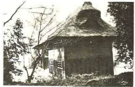
歴代名主だった小沢家に 今も残る長屋門

現在、青木、大堀、二間塚の発展がいちじるしく、この二部落はそのかげにかくれているが、それほど純農村の底力を今にとどめている部落である。それだけに、昔からあまり問題のおこらない平和な部落だったようだ。