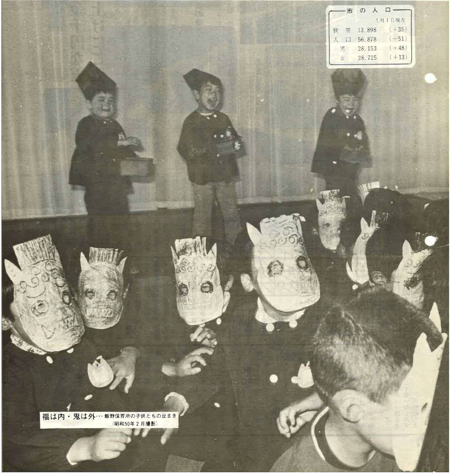
福は内・鬼は外…飯野保育所の子供たちの豆まき (昭和50年 2月撮影)