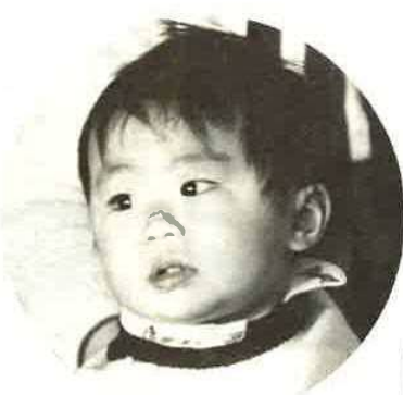
広報の写真にあなたがのっていたら サービサイズ1枚さしあげます。 申し込みは広報係まで