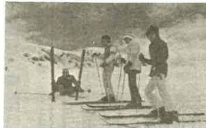
昨年のスキー教室で