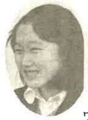
ワァー うれしいな 新校舎に入れたよ