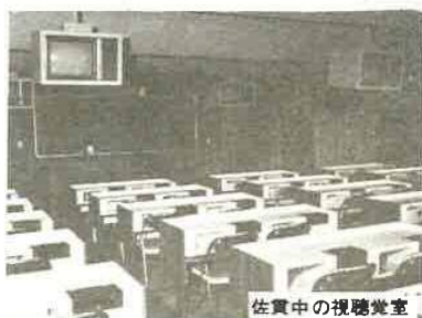
佐貫中の視聴覚室

新しい教室、新しい机と椅子、新鮮な感じだ。まだ、だれにも使われていない。ぼくたちが最初だ。特別教室は、近代的な感覚で整備され、各階のホールは、楽しい憩いの場になっている。運動の面でも、今までなかった更衣室ができ、不便が解消された。校底も拡張され、整備もすすみつつある。新校舎に入れなかつた先輩達は残念に思われるが、それだけぼくたちは恵まれているのだとあわせを感じる。今思うに、これだけの校舎