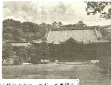
西上総三大寺の一つだった真福寺

毎年四月二十一日の御影供は、近郷近在の人を集めて、昔から有名だが、これも近年ますます盛んになっている。