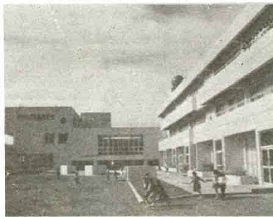
カラフルな建築の湊小

湊小学校は、昭和五十年四月着工、五十一年八月完成、総工費五億二千三百万円。鉄筋コンクリート三階建て、延面積四〇二五平方メートル。児童棟と管理棟の二棟で、カラフルな建物、外縁や中庭は小公園の趣きを添え、児童の情緒の安定に特別な考慮がはられています。