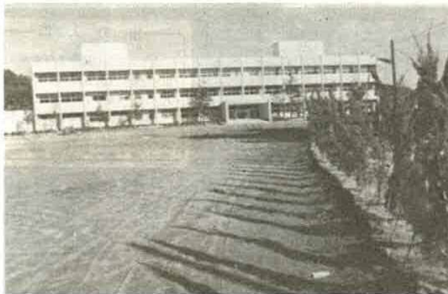
三階建ての佐貫中

面積二、八六四平方メートル、鉄筋コンクリート三階建ての明るい建物には、各階に広くロビーをとり、生徒の憩いの場とするなど、新しいところもみられ、視聴覚室は特に最新の設備が整っています。