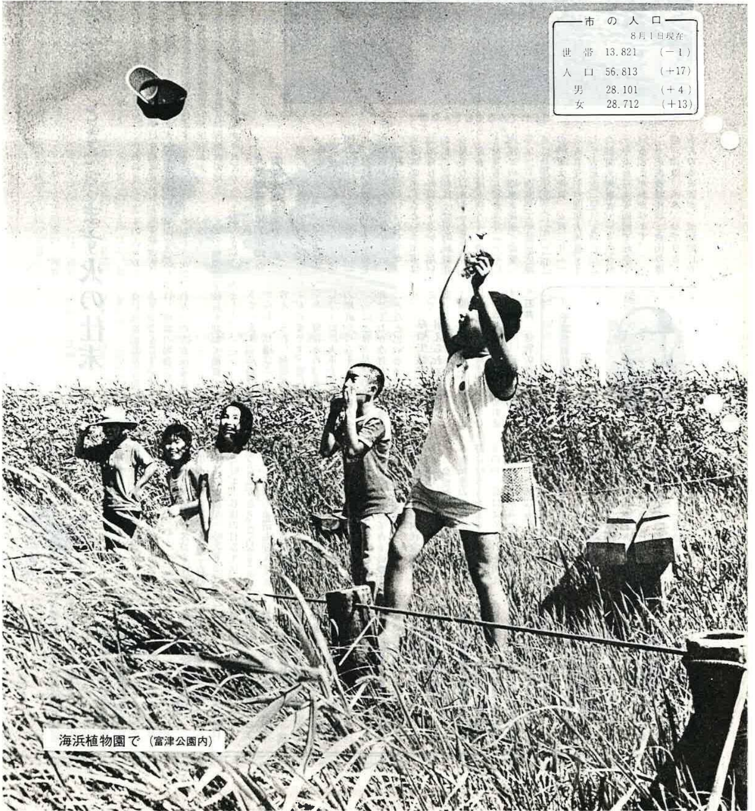
海浜植物園で (富津公園内)