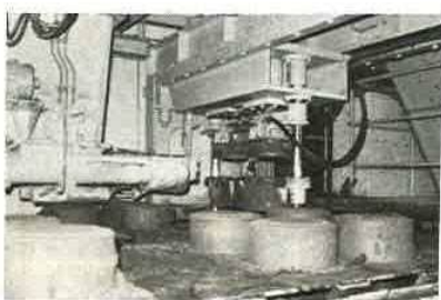
固形にして送られる灰

いままでは焼却炉の灰の処理には、二次的公害でさわがれておりましたが、この工場では、出た灰をセメントなどにまぜて固め、厚さ三〇センチ位の円柱にして処理するなどの作業が一貫した流れ作業で行われ、ベルトコンベヤーから出てくる灰の固形をみると建材の製造工場を思わせます。