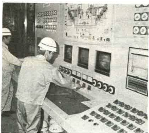
工場のように一目でわかる中央制御室

三月号で紹介したゴミ清掃工場も、四月から一部試験的に稼働していましたが、いよいよ今月から本操業に入りました。これまで、三カ所で一日十九トンだったゴミ処理も、六十トン（八時間稼働）が処理され、市内排出量、約五十トンといわれるゴミも完全に処理出来るようになり、ゴミのない街づくりに、大きく役立ってくれます。