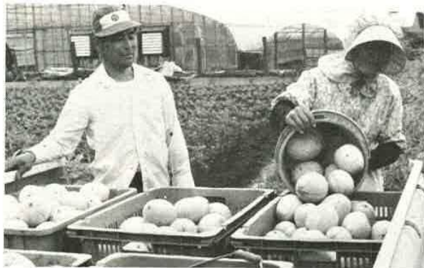
▲ 畑には甘い香りが一新井 今年も富津地区の農家ではプリンスメロンのとりいれで大いそが し。例年ですと1,400トン近くとれるのですが、今年は気候が悪く収 穫量は減りそうとのことです。