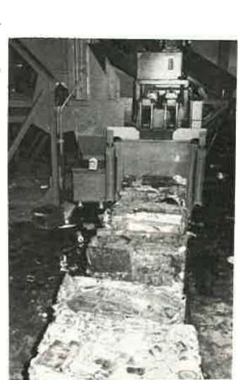
缶など、鉄くずはスクラップに

燃える物、燃えない物の仕分けを厳守しましょう ◎ ダンボール箱はなるべく使用しないこと。 先日燃えるゴミとして出されたダンボール箱の中に座イスが入っており、それが原因で故障を起しております。一々開けて中を調べることは不可能です。もしやむをえず箱を使用する場合は必ず燃えない物は別にして出して下さい。