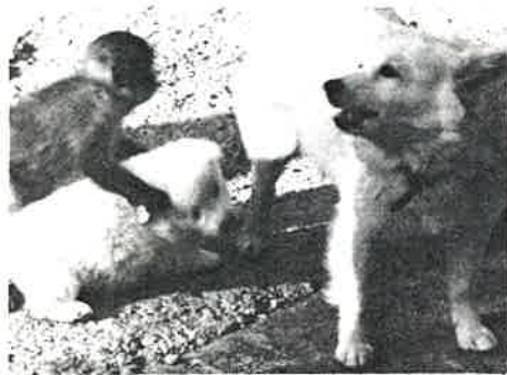
仲の悪いことを「犬猿の仲」というけれど？ 迷い子の子ザルを自分の子同様に育てる親犬 最近生れた子犬も大の仲よし、毎日楽しそう に遊ぶ犬と猿。