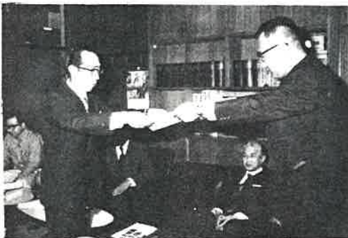
目録を受ける学校代表