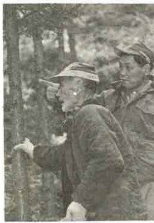
飲酒運転は、交通違反のな