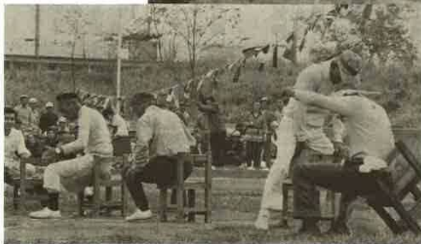
いきおいあまって…… (けつ圧測定)

このくつボクに丁度 いいかな!!! ▲ 10月20日青堀奉仕会では恒例の「のみの市」(参加店二十店)でにぎわった。 この市は一年に一度、感謝の意味をこめて開かれ、出血サービスに集まったお客さんも恵比須顔。