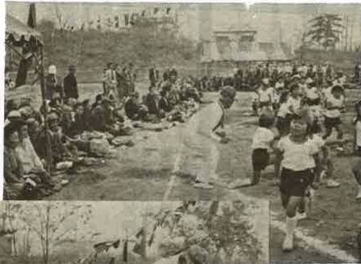
幼稚園の子供と 踊り出すおじいちゃん

君津郡市のお年寄りのタートルピック (運動会) が 10月11日に木更津市営球場で開かれました。玉入れや、綱引きなど六種目を、若い者も願まけのきびさびした動きで、はりきっていました。