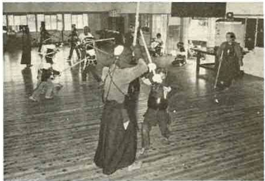
▼ 練習中の関豊小の児童