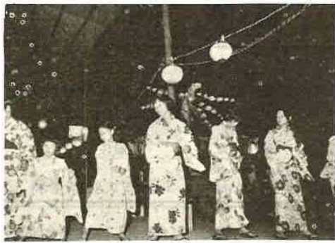
富津音頭に合わせて ▲ 天羽地区更和にて

今年の夏は例年になく盆踊が各地で盛んに行なわれました。老若男女が入りまじり夏の夜を「富津よいとこ」の一筋に合わせ涼しさを満喫しているようでした