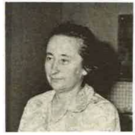
富津地区川名にある、その名の門学園(婦人厚生施設)と楽生園(老人ホーム)の園長夫人。

問 日本の福祉について何か ドラ・木下 日本の福祉も戦後は大きな進歩をし、形態は一応どのつていていると思えます。しかし、日本ではまだ官製の福祉という傾向が強いのです。ドイツでも、東ドイツは政体の関係から、国による福祉という面が強く、西ドイツは、ボランティアの面が強いのです。どつちがよいというわけではありませんが、日本でもっと社会の善意によるボランティアの活動がほしいですね。リハビリテーションは社会の善意なしには出来あ