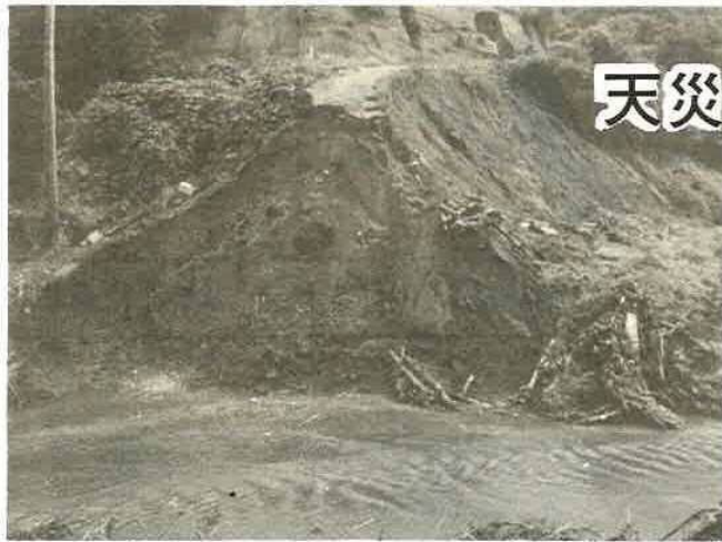
45.7.1集中豪雨災害実況 (芥線林道流失)