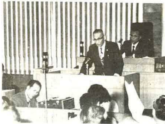
議場にて市政方針を語る市長

6月17日定例市議会の席上、白井市長は議会に対してつぎのような市政方針演説をおこないました。