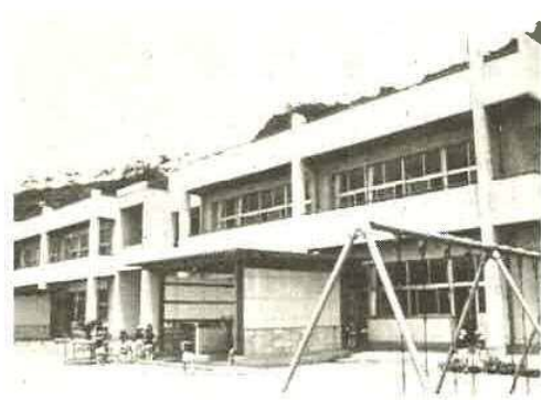
児童の安全第一の金谷小

青堀小は、工費六億七千八百八十万円、四十九年一月着工、本年二月二十八日完成された鉄筋コンクリート三階の教室棟と、特別教室を入れた鉄筋コンクリート四階建の管理棟の二棟からなり、延面積五九二四㎡の広大なもので、