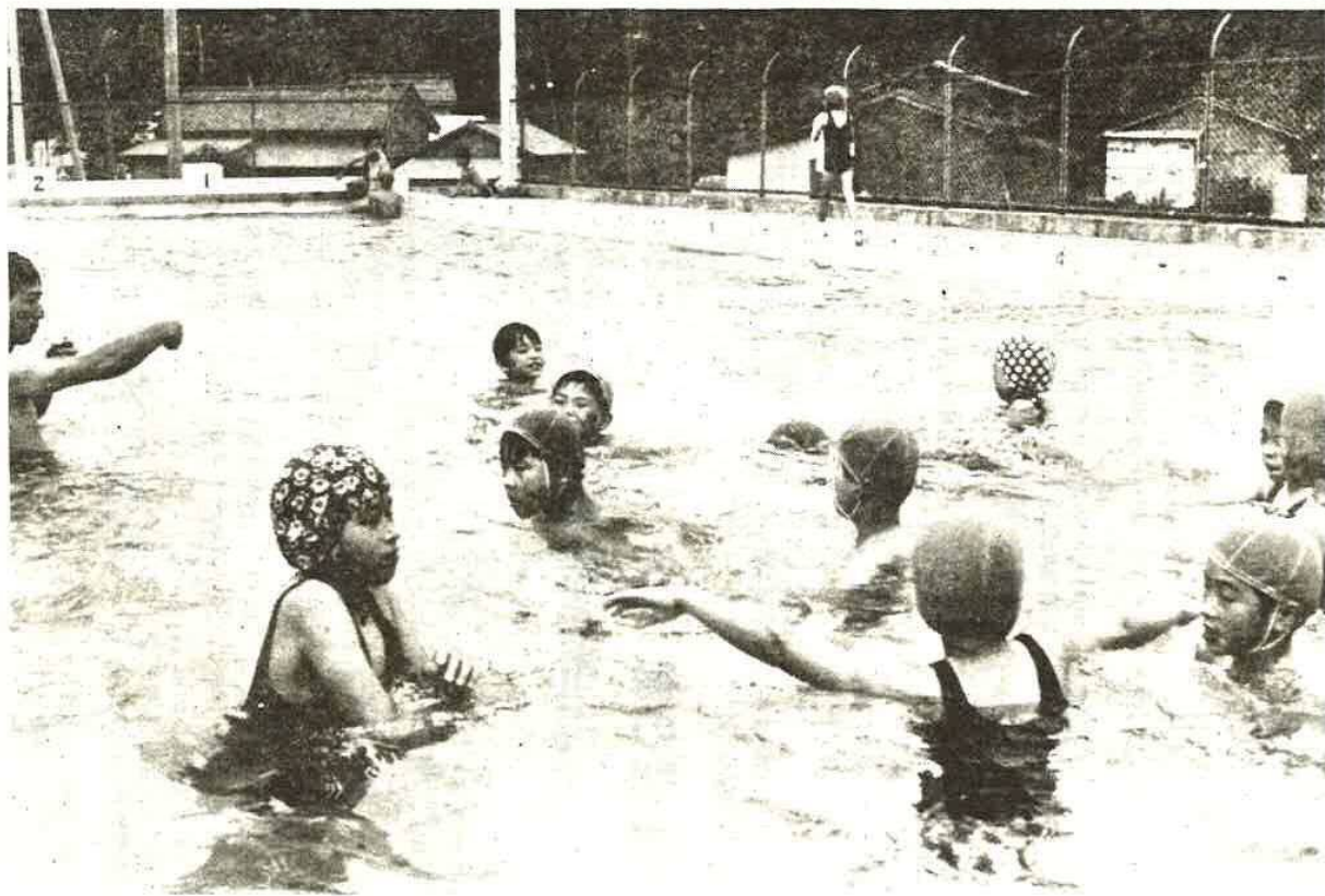
ワツつめたい!! プール指導をうける関豊小の児童 (環小にて) (昨年7月写す)