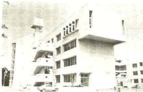
▲ でっかく完成した児童数752人の青堀小

いま七五二人の生徒が、この完備した施設で学んでいます。音楽教室、器楽教室は、小劇場を思わせる設備であり、屋上には非常時のための救命袋もそなえられる等、至れり尽せりの設備です。