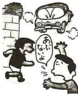
●とび出しは危険なのでやめましょう

夏は暑さによるつかれ、だるさ、ねぶそくなどにくわえ、交通渋滞が多く、ひよつとしたことから、悲惨な事故がおこりがちです。無理な追い越し、飲酒運転、暴走運転は絶対にやめましょう。