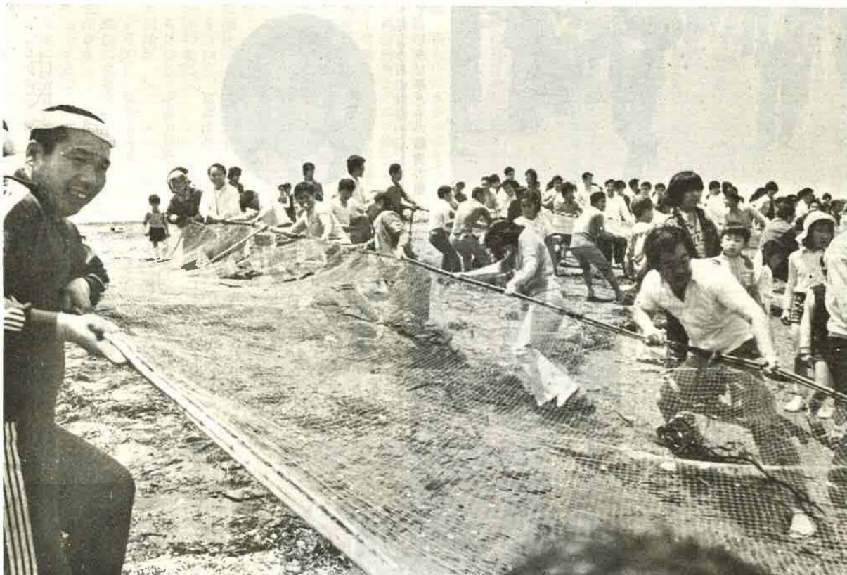
地曳網をたのしむ観光客 (富津海岸)