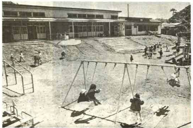
完成した金谷保育所