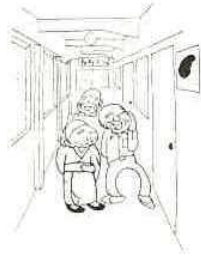
福祉施設の人たちのために

昨年の富津市の「赤い羽根募金」の目標額は百四十九万二千円でしたが、みなさんのご協力によって、この目標額を上まわる百六十七万九千二百四十六円があつまりました。これに対し、富津市への配分金は ○市社会福祉協議会へ七十八万七千三百四十六円 ○富津「望みの門」楽生園へ六十四万円 ○同じく「望みの門」学園に十五万円 ○そのほかに、NHK歳末たすけあい募金の配分金が、「望みの門」へ三十五万九千二百円 ○市町村歳末たすけあい募金