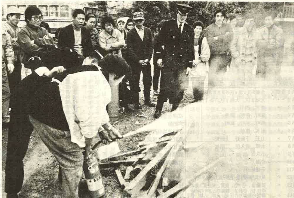
消火器の使い方の指導を受ける主婦 (友和産業社宅広場)

(1) 編集発行 / 千葉県富津市役所 電話 天羽 (04396) 7-0511 昭和50年3月1日 第35号