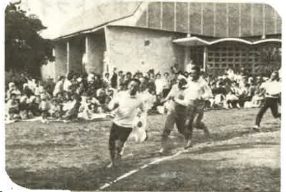
おばちゃん頑張ってる!!

よく晴れた「体育の日」富津地区では、市民体育祭にかわるにぎわいで、農協大運動会が開かれた。ふだんはおすましの婦人部のお母さんたちや、役員のお偉方も、この日はやはりハッスル、また富津農協音頭の披露もおこなわれました。