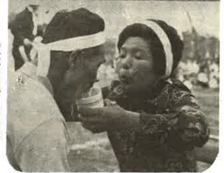
アベックモは喰い競走