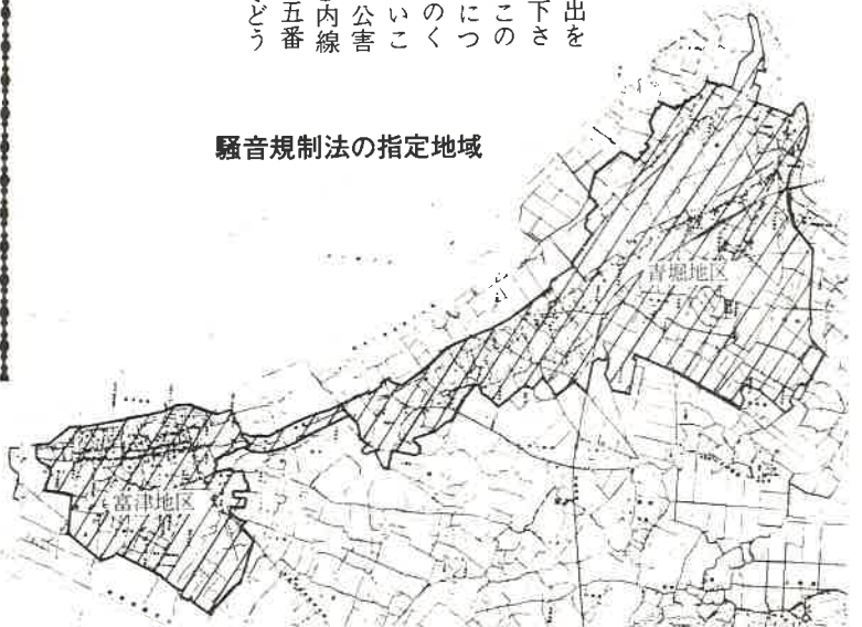
騒音規制法の指定地域