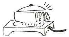
煮こぼれて火が燃えないよう注意

秋の全国火災予防運動は、11月26日(㊤)から12月2日(㊤)までの七日間実施されます。