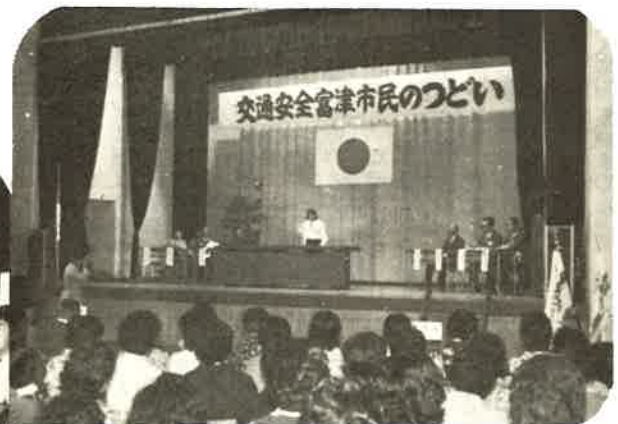
交通安全 市民のつどい ▲

オイ たのもぞ!! ◀ 十月四日、秋晴れの富津公園で、市内小学生のロードレースと中学生の駅伝大会がおこなわれました。 ロードレースでは富津小が一位、駅伝は一位の富津中が、二位天羽東中に四十秒の差をつけ優勝し、三位は大貫中が入りました。