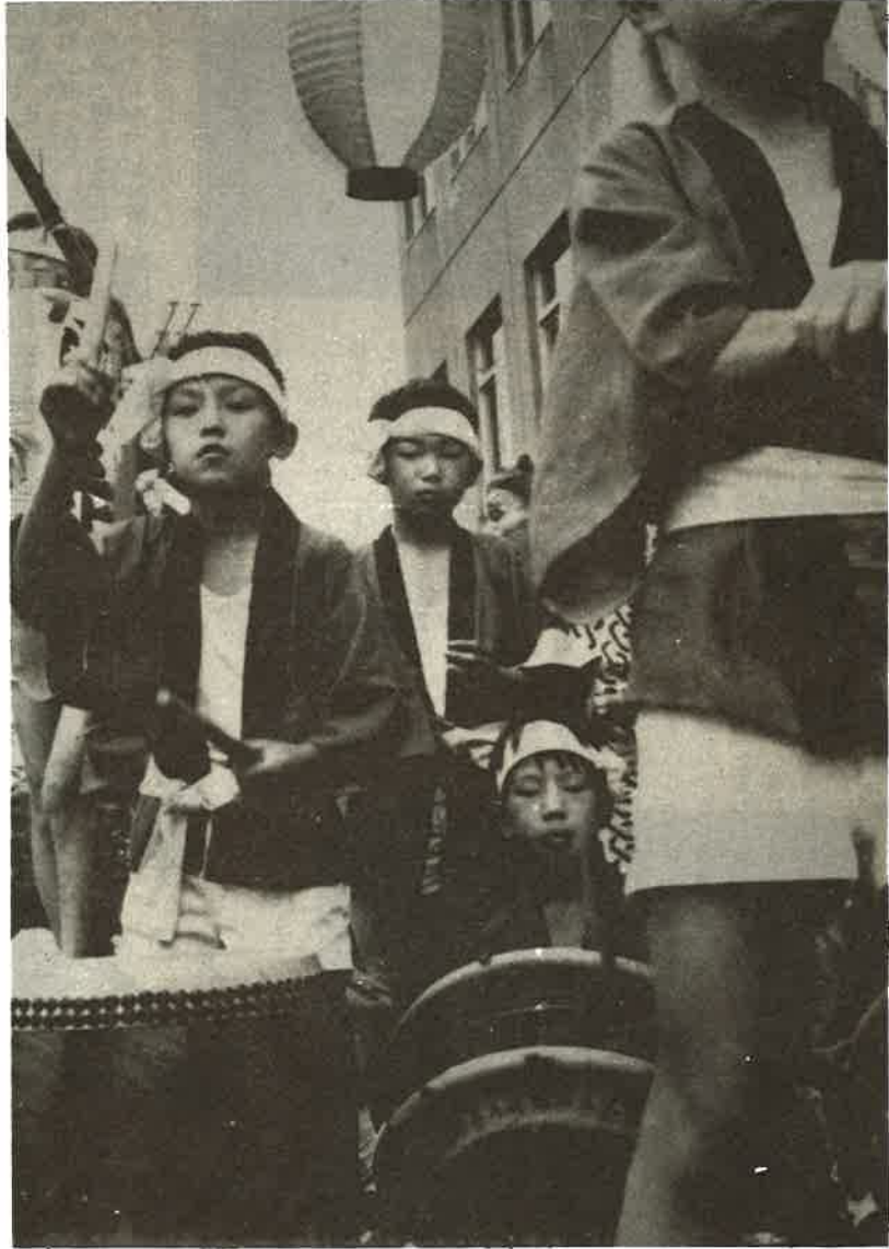
トコトン、トコトン、トントコトン、青木の子ども達のおはやし