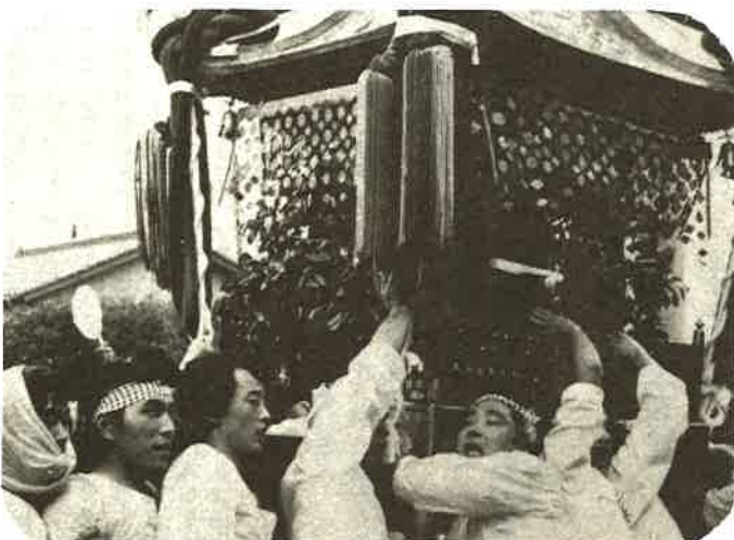
青木の青年たちのお神輿かつぎ

7月8日の集中豪雨で、富津、大佐和地区では床上浸水13世帯、床下浸水492世帯のほか田畑に甚大な被害をうけた。平垣地の豪雨に対する力の弱さをみせ、防災の大切さを感じさせられました。平素から排水路の掃除などに心がけて下さい。