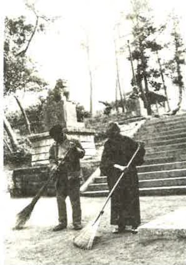
八幡神社境内を毎朝掃除するお年寄り

これは市民それぞれが捨て方の工夫を考えて見る必要があるようです。テレビ、冷蔵庫、洗濯機、バイク、自転車など、どうにも困るものは、それぞれの業者に相談するなり、市の係に相談するなりすれば、何か適当な方法がみつかる筈です。