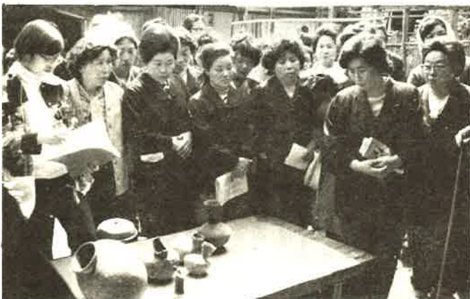
内裏塚出土品を見学する婦人たち

婦人会で4月18日、第2回史跡めぐりをおこない、小川政吉先生のご指導により、大佐和、富津地区の史跡を見学して廻った。