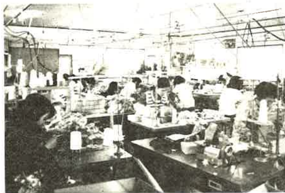
実習中の生徒たち

問 何か市民として一言。 校長 自分の仕事をまっとうすることが、市民としての一番のつとめだと思っています。