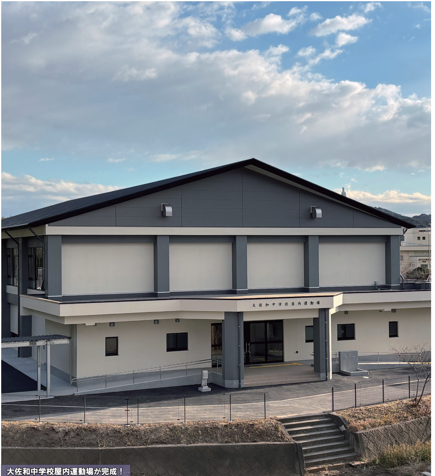
大佐和中学校屋内運動場が完成！