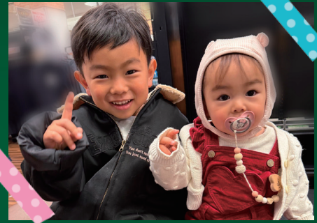
★ひとことコメント★ なかよし兄妹★

♪やんちゃざかり募集中♪ <対象年齢> 市内在住の0~10歳のお子さん ※きょうだいで掲載する場合は、一番下の子が対象年齢に当てはまっていれば掲載できます。 <申込方法> 応募フォームから申込みか、秘書広報課窓口または電話 詳細は秘書広報課 (☎ 0439-80-1225) までお問い合わせください。