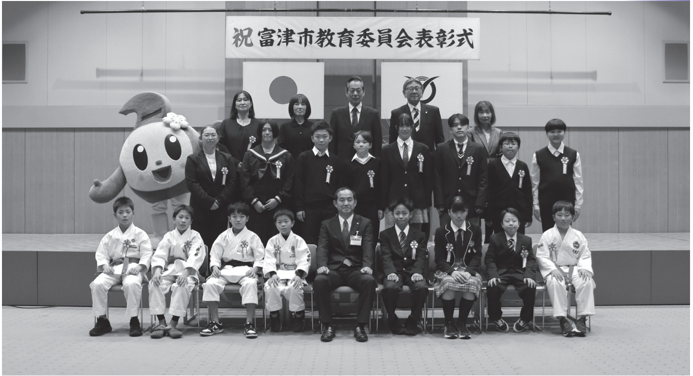
▲ 富津市教育委員会表彰式