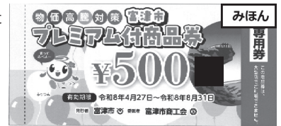
富津市プレミアム付専用券