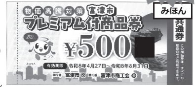
富津市プレミアム付商品券