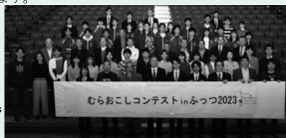
▲昨年の発表会後の記念撮影