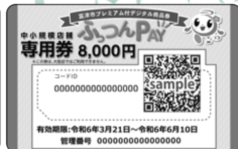
▲中小規模店舗専用券 8,000 円