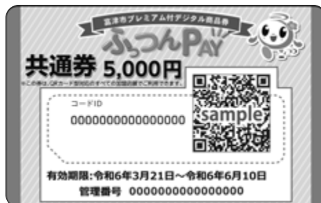
▲共通券 5,000 円