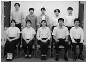
▲実行委員の皆さん

7月30日、「富津市二十歳の集い実行委員委嘱式・第1回実行委員会」を開催しました。令和6年1月7日(日)の式典に向けて、二十歳代表として委嘱された10名の実行委員が企画や準備を進めています。