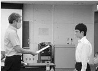
▲市長から委嘱状を交付しました。◎委員長、○副委員長