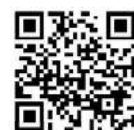
▲教室・講座の一覧

☎中央公民館 0439-65-2251、富津公民館 0439-87-8381、市民会館 0439-67-3112