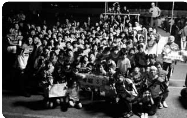
▲ふるさとまつり賞を受賞した青堀サッカークラブの皆さん

8月16日、富津市恒例の夏祭り「富津ふるさとまつり」がイオンモール富津を会場として開催されました。