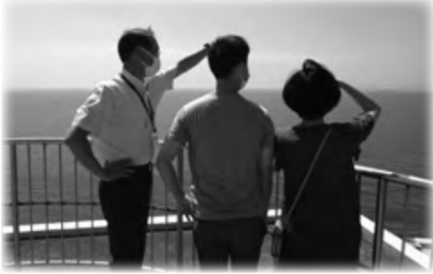
▲移住コンシェルジュによる市内案内