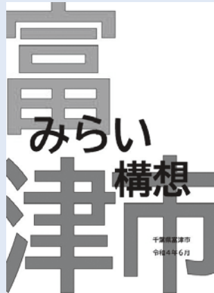
▲富津市みらい構想の冊子（表紙）