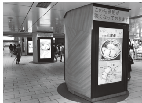
▲東京駅での移住・定住PR

首都圏の方に富津市を知ってもらい、移住定住を促進するために7月から8月にかけてJR東京駅、横浜駅構内のデジタルサイネージにて15秒のプロモーション映像を放映しています。