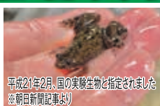
平成21年2月、国の実験動物と指定されました ※朝日新聞記事より