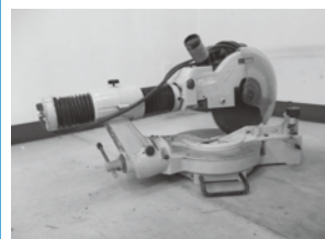
▲差し押さえた財産の一例