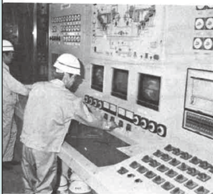
工場のように目がわかる中央制御室

三月号で紹介したゴミ清掃工場も、四月から一部試験的に稼働していましたが、いよいよ今月から本操業に入りました。これまで、三カ所(一日十九トン)だったゴミ処理も、六十トン(八時間稼働)が処理され、市内排出量、約五十トンといわれるゴミも完全に処理出来るようになり、ゴミのない街づくりにも、大きく役立ってまいります。