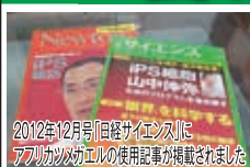
2012年12月号「日経サイエンス」にアフリカツメガエルの使用記事が掲載されました