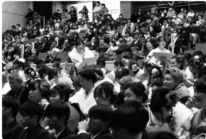
令和2年成人式の様子