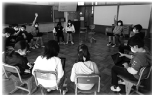
天羽小学校での情報端末を活用した授業