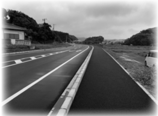
手前が市役所方面、右奥が大佐和中学校

大貫小学校・大佐和中学校の児童・生徒および歩行者の安全性・利便性を確保するとともに、市役所周辺の交通の円滑化を目的とした市道小久保岩瀬線を5月1日に供用開始