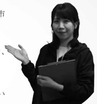
▲健康づくり課 上野保健師

富津市では、がんによる死亡率の減少を目指し、各種がん検診を実施しています。自分や大切な人の健康を守るためにも、ぜひ、がん検診を受けましょう。