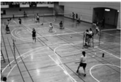
▲バドミントン大会での中学生による試合