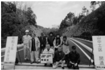
▲開通を祝う地域住民の皆さん