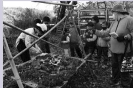
▲真剣な眼差しで火起こしを見学する子どもたち

市内の小学生を中心に20人の子どもたちが参加し、密にならないよう3つのグループにわかれました。違う学校・学年の友達との活動でしたが、子どもたちはすぐに打ち解け、森の中でのネイチャーゲーム、アスレチック・芝滑り体験、ボーイスカウトによる火おこし教室など、元気いっぱい自然の中をかけまわりました。