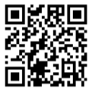
洪水ハザードマップ