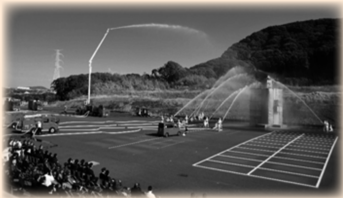
▲消防団員・署員などによる出初式での消火訓練