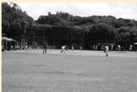
▲暑い中、懸命にプレーする選手たち

8月2日、富津市少年野球連盟主催の第36回富津市少年野球夏季大会が市民ふれあい公園球技広場で開催されました。