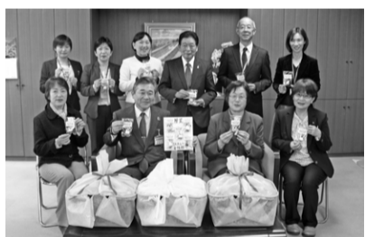
▲交通安全を祈念したお守りをいただきました。