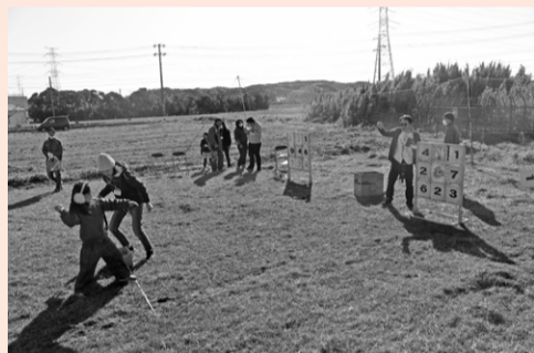
◀ストラックアウトに挑戦する子どもたち

11月30日に、飯野コミュニティセンターで第32回富津市育成大会が行われました。