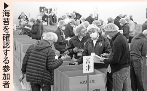
▶海苔を確認する参加者

12月9日に、千葉県漁業協同組合連合会のり共販事業所で、第1回乾のり入札会が行われました。