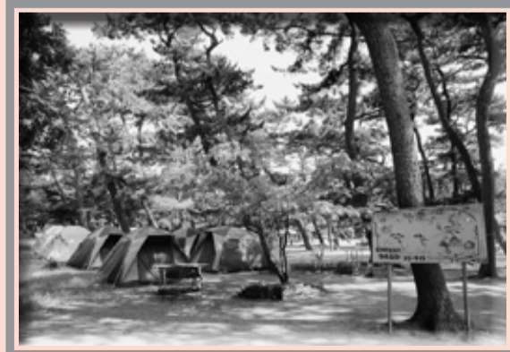
▲富津公園キャンプ場