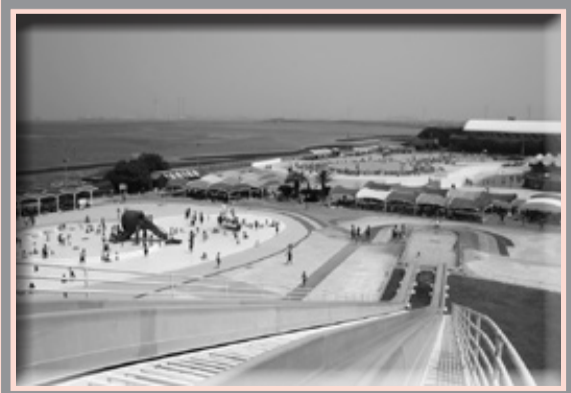
▲富津公園ジャンボプール