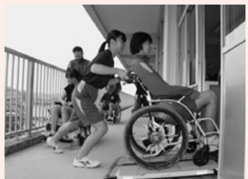
要支援者への対応を車いすを使って学びました。

出訓練、29の関係機関・団体・企業のブース展示、防災科学研究所職員による避難訓練の振り返りなどが行われ、大貫中学校の全校生徒をはじめとする約600人が参加しました。大貫中学校の生徒たちは、車いすを使って避難時の要支援者への対応方法や、避難所生活でのエコノミークラス症候群を予防する体操などを学んだほか、会場準備などを手伝ってくれました。