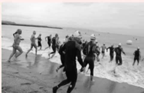
一斉に海へ向かう選手たち

6月9日に「第5回千葉県・富津海岸オープンウォータースイム大会」が行われ、約80人の選手が出場しました。競技前には、参加選手により、海岸清掃も行われました。オープンウォータースイムとは、海や湖で行われる長距離水泳で、風や波などの影響を受ける競技です。この日は波が少し高く、水温も低い厳しい環境のため、リタイアする選手もいましたが、大会は無事に終了しました。