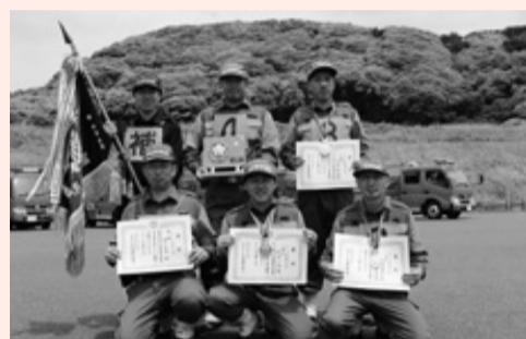
ポンプ車の部 優勝第6分団