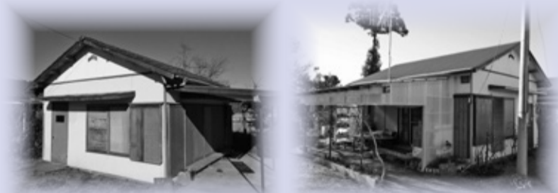
※家屋の写真はイメージです。

市と宅地建物取引業協会は、取引や契約の手続きを連携・協力して行うため、5月29日に「富津市空家バンクを活用した移住・定住促進活動に関する協定」を締結しました。