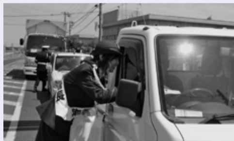
安全運転を呼びかけました。