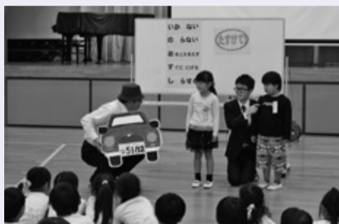
不審者に声をかけられたときの対応を学ぶ子どもたち

4月24日、青堀小学校1年生を対象に、内房地区少年センターによる防犯教室と、富津警察署・富津市防犯協会による防犯グッズの贈呈式が行われました。