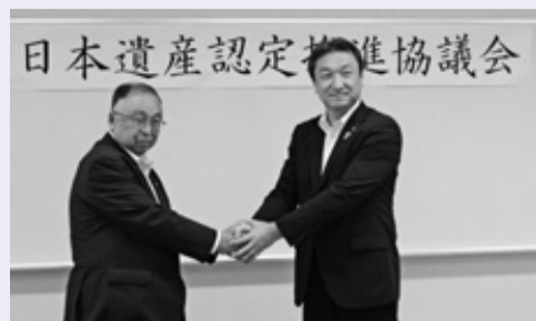
鋸南町とともに日本遺産登録を目指します。

日本遺産認定には、鋸山の持っている歴史的な背景とともに、観光資源としての魅力も必要になり、これらをひとつの物語(ストーリー)