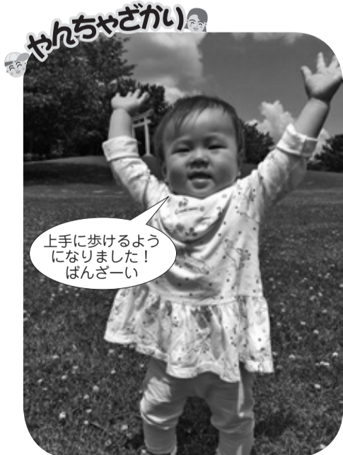
上手に歩けるようになりました！ ばんざーい