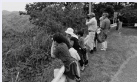
大きな声で「ヤッホー」と言っ子どもたち

5月12日、「環南みんなの楽校」が旧環南小学校で行われました。これは、志駒・山中地区の皆さんが中心となって、年間を通じて親子を対象に開催しているものです。