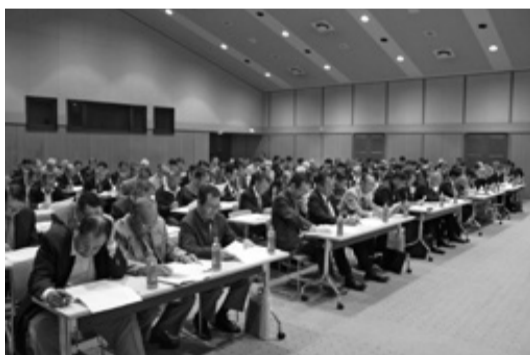
▲4月19日に行われた富津市区長会議

区長は、行政事務の連絡や調整の他、区民の皆さんの要望を市に伝えるなど、市政の円滑な運営と地域の活性化のために尽くされています。閩市民活動推進室☎80・1252