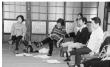
▲いきいき百歳体操に取り組む皆さん