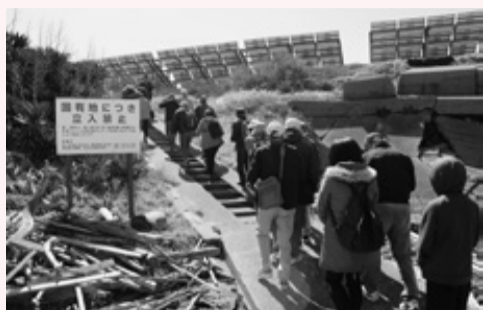
期待に胸を膨らませて上陸

3月24日に、富津市民限定第二海堡上陸ツアーが午前と午後の2回行われ、約120人の