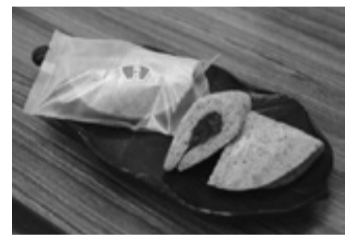
▲補助対象となった特産品