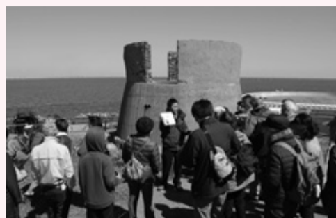
ガイドの説明を熱心に聞く参加者

皆さんが参加しました。富津埠頭を出発した船は第二海堡に40分ほどで到着し、上陸後に海堡に残っている砲台・防空指揮所・倉庫などの遺構を見学しました。