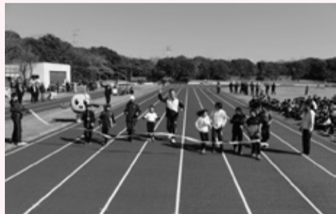
新しいトラックを走る子どもたちと市長

ランニングクリニック終了後には、陸上競技場の無料開放が行われ、多くの人々が新しくなった陸上競技場を利用しました。