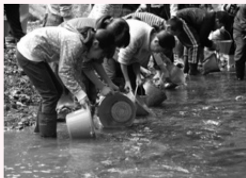
多くのアユを放流する児童たち

この他にも組合員による放流が約10カ所で行われ、2日間で約50,000尾の稚魚が放流されました。