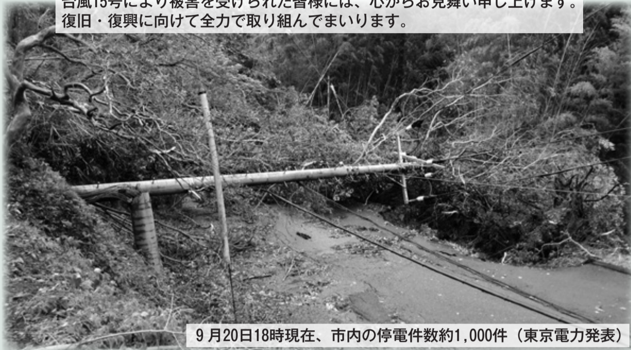
9月20日18時現在、市内の停電件数約1,000件(東京電力発表)

台風15号により被害を受けられた皆様には、心からお見舞い申し上げます。復旧・復興に向けて全力で取り組んでまいります。