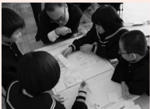
税について真剣に議論しました。

12月5日、天羽東中学校で「“考え 議論する” 討議形式版租税教室」が開催されました。