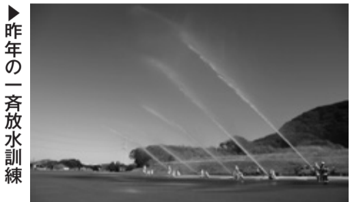
▶ 昨年の一斉放水訓練

日時 1月13日(日)9:30~ 場所 消防防災センター車庫棟・訓練場 内容 【第1部】消防職・団員表彰、【第2部】幼年消防クラブ(富津保育園)および大貫中学校プラスバンド部による演奏や消防団による小隊訓練、企業消防隊との合同放水訓練 ※荒天時は、車庫棟で第1部のみ実施。 富津消防本部総務予防課 ☎88・6403