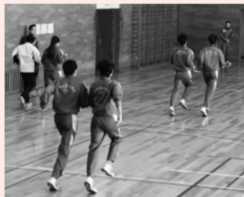
▲ブラインドマラソンを体験しました。

生徒からは、「伴走者がいてもアイマスクをして走るののは恐かった」「2人でタイミングを合わせるの難しかった」などの感想がありました。