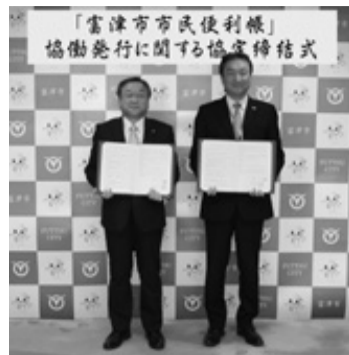
▲11月26日に(株)サイネックスと協定を締結しました。