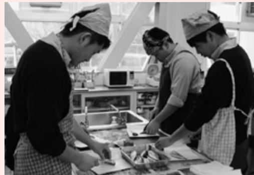
▲手際よくアジをさばきました。

今回は、調理や福祉などについて学ぶ「生活コース」の生徒が受講しました。日頃から包丁の扱いには慣れているようで、上手にアジをさばき、「なめろう」と「さんが焼き」を作りました。