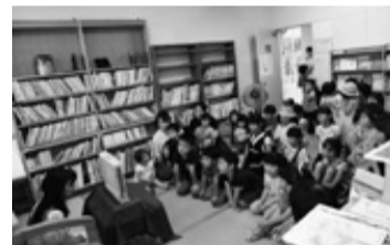
▲新たに畳を敷いた図書室で読み聞かせ

今回、市民活動団体nigiwaiを中心とする人たちが行った、公民館の図書室のリニューアル、公民館カフェ、フリーマーケットなど、いろいろな活動を通して地域住民が繋がることを目指した取り組みが選ばれました。