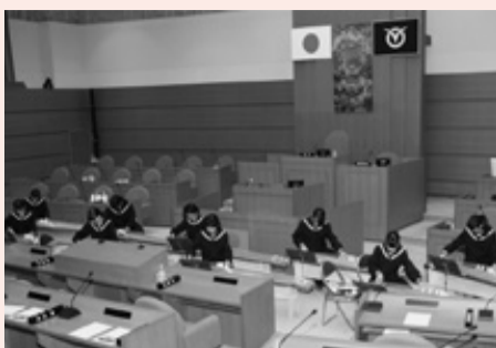
箏の音色で議場は和やかな雰囲気になりました。

12月6日、「第24回議場コンサート」が開催され、佐貫中学校の生徒9人が、箏により「姫松」「さくらさくら」「アムール河の波」の3曲を披露すると、議場に集った大勢の人から拍手が送られました。