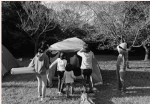
寒い中テントで泊りました。

参加者は協力して、テント張り、ロープワーク、薪割り、火起こし、ビニール袋を用いた炊飯などの体験や、防災講座、応急処置訓練に取り組みました。