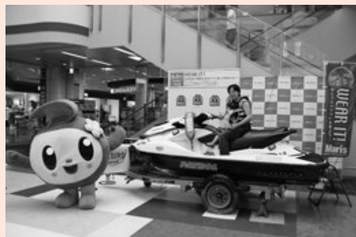
▲親子でライフジャケットを着て参加しました。

イベントの中では、富津市消防署の救急救命士によるAEDを含む心肺蘇生法の実演と体験会も行われ、参加した人たちは熱心に聞き入っていました。