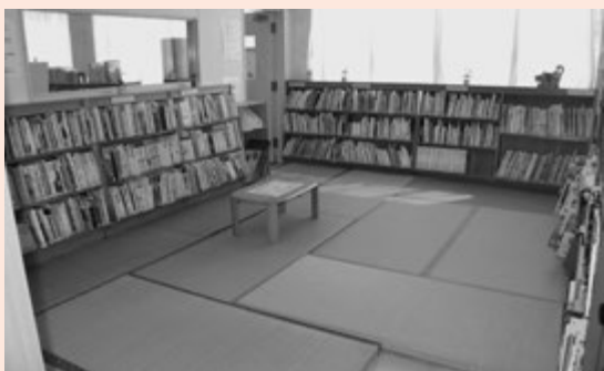
▲nigiwaiの皆さんの提案で設置された、畳の上で親子で一緒に本を読むスペース

その他、地域を盛り上げて地元での交流を図りたいとチャリティーイベント“公民館カフェ”も開催しています。