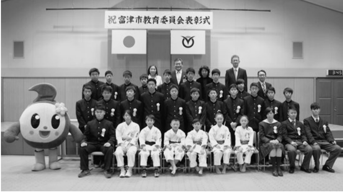
富津市教育委員会表彰を受賞された皆さん