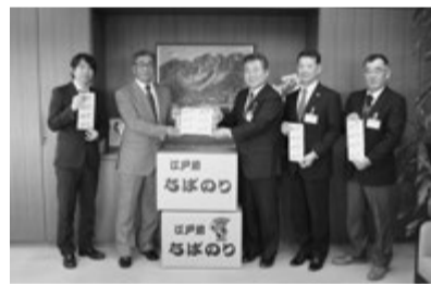
▲小泉代表理事組合長(左から2番目)から手渡されました。