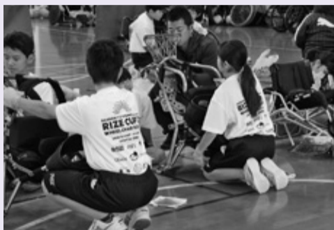
◀生徒たちが試合のサポートをしてくれました。

富津中学校の生徒が校長先生とともに、朝早くから車いすの車輪の清掃や試合間の床清掃などのボランティアをしてくれました。