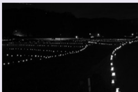
◀竹燈籠が暗闇を照らしました。