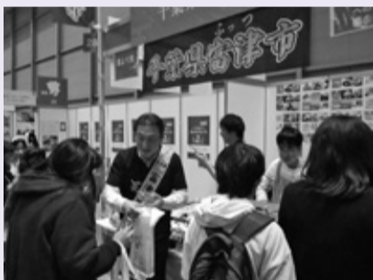
◀市長も参加して寄附の返礼品をPRしました。