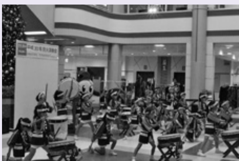
◀元気づく演奏し、防火を呼びかけました。