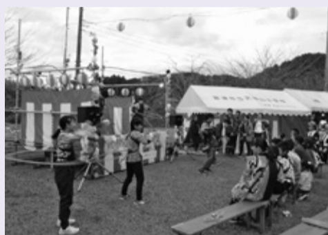
◀子どもたちと東大生がフラフープ対決

海良区・売津区のお囃子もやってきて、3地区の子どもたちによるお囃子のたたき合いが行われました。