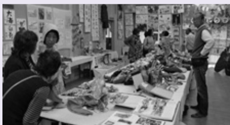
◀多くの作品が展示されました。

11月3日・4日、竹岡文化協会主催で「第46回竹岡地区文化祭」が竹岡コミュニティセンターで行われました。